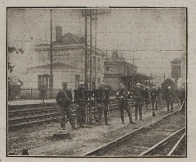
Le garde des votes forcés. Le gouvernement français, en présence d'un corps à pied toutes les mesures nécessaires et fait garder les votes forcés.